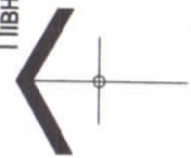
Схема розташування території у планувальній структурі населеного пункту М 1:2 000 Північ